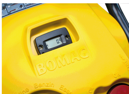
Più trasparenza Contatore e contagiri con service display