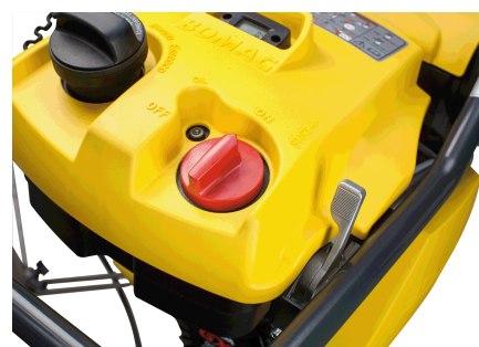
Di facile comando Motore e alimentazione carburante con interruttore combinato