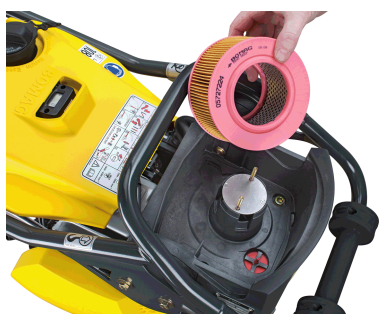
Massima affidabilità e durata utile Protezione totale del motore