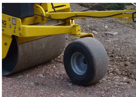
Comando confortevole Kit ruote (opzione)