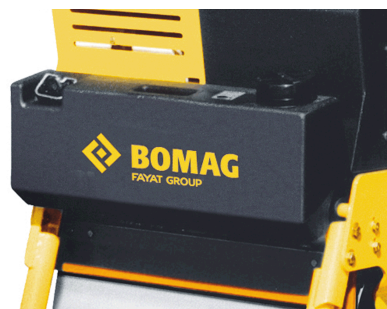
Non aderisce sull'asfalto Spruzzatura d'acqua con grande serbatoio dell'acqua (standard)