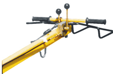
Comando preciso e sicuro Tutte le funzioni integrate nella testa timone