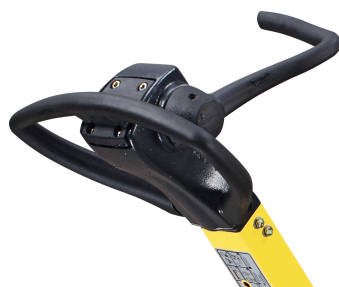
Comando preciso e sicuro Comando monoleva BOMAG