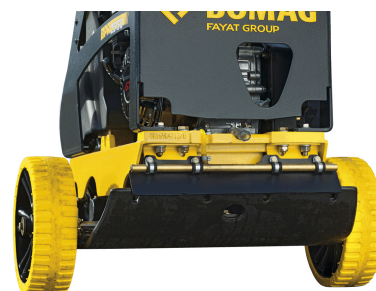
Trasporto facile e sicuro Ruote di trasporto (opzione)