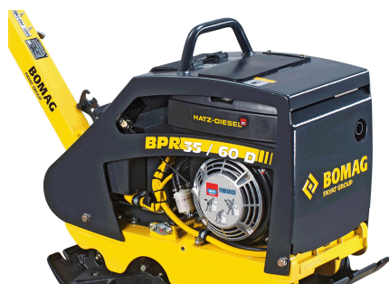
Robusto e affidabile Migliore protezione dei componenti